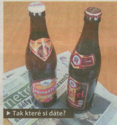
► Tak které si dáte?