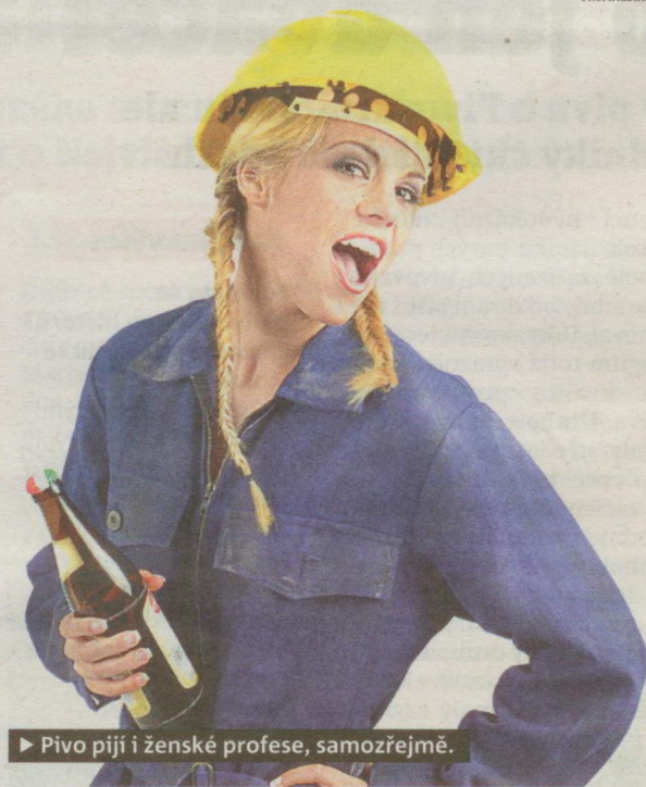
► Pivo piji i ženské profese, samozřejmě.

„Bude-li kons- zvláště pak tovární ku, ponecháno na volil mezi sklenicí piva a lahví sodov- máme za to, že mu zatěžko se rozho- psal Kvas 14. úno- Tedy alespoň v přípa- deňské ministerstv- limonády více zdan- poje budou zhrub- drahé. Jde přece o z- níků! ● LIBOR HRUŠKA