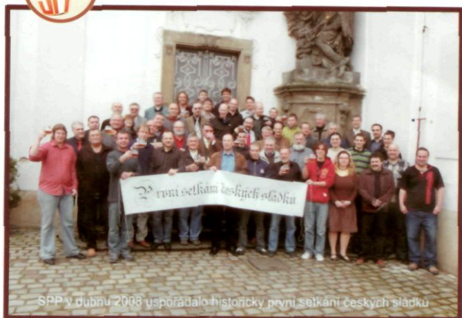
SPP v dubnu 2008 uspořádalo historicky první setkání českých sládků

Sdružení přátel piva Hybernská 7 110 00, Praha 1 info@pratelepiva.cz